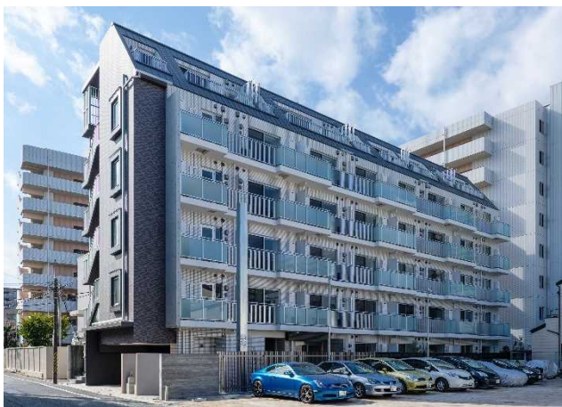
【ディームス清澄白河】（東京都江東区白河四丁目）