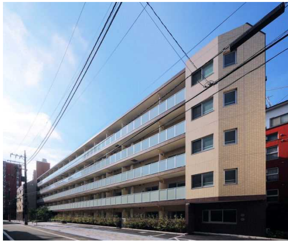
【ディームス品川戸越】（東京都品川区荏原二丁目）