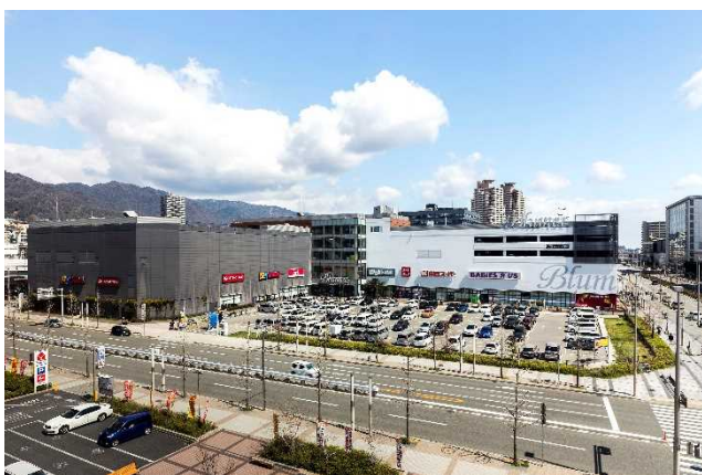
【ブルメール HAT 神戸】（兵庫県神戸市中央区脇浜海岸通二丁目）