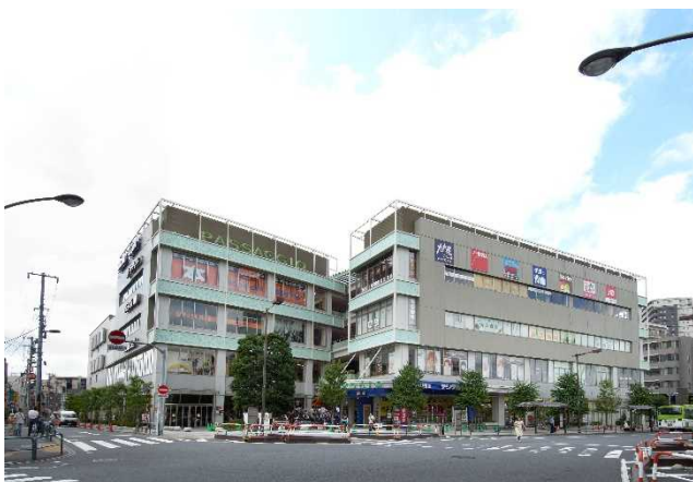
【パサージュ西新井】（東京都足立区西新井栄町一丁目）