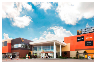
クローバー・モール