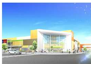
メープル・モール